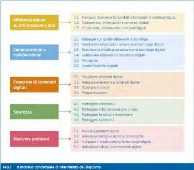
FIG.1 Il modello concettuale di riferimento del DigComp